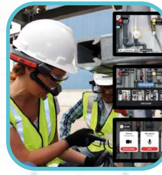
Probar la experiencia del usuario en campo