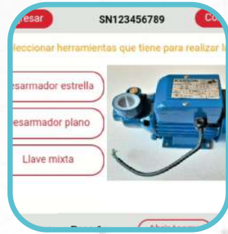
Suscripción a Digital Workflow