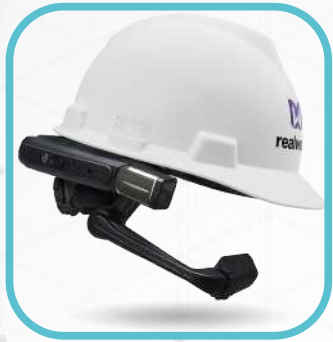
Un casco Realwear